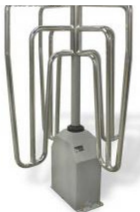
Fig. 3: Molinete

Los paneles giratorios suelen ser de cristal, metacrilato o plástico, mientras que las barras son de acero inoxidable o aluminio. Su funcionamiento puede ser unidireccional o bidireccional, facilitando el paso en uno o dos sentidos. El paso puede ser continuo o supeditado al control de sistemas electrónicos (teclados, lectores, biométricos,...).