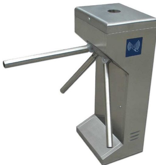
Fig. 1: Torno de control de accesos

Son equipos que constan de un mueble donde se hallan los mecanismos necesarios para controlar el funcionamiento de tres barras o brazos en forma de trípode, los cuales giran 120° por impulso para permitir el paso individualizado de las personas, permaneciendo uno de los brazos en posición horizontal con la intención bloquear el acceso.